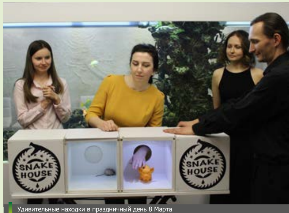
Удивительные находки в праздничный день 8 Марта

Добрые слова поздравлений накануне Дня защитника Отечества звучали и на шахте «Юбилейная». Женская половина коллектива пожелала коллегам-мужчинам оставаться мужественными в любых жизненных ситуациях. А Международному