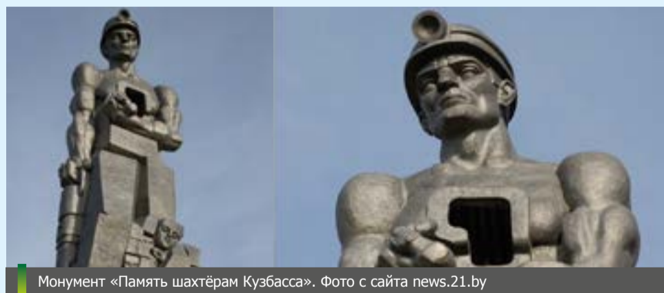
Монумент «Память шахтёрам Кузбасса».