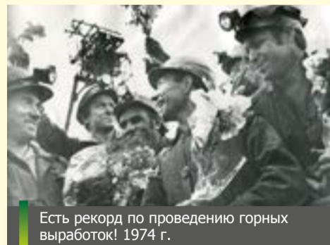
Есть рекорд по проведению горных выработок! 1974 г.

В середине 50-х годов прошлого века в угольной отрасли Кузбасса начинается новая эпоха – внедрение технологии гидродобычи. В регионе строят гидрошахты «Байдаевская-Северная №1» и «Байдаевская-Северная №2». Позже их объединили в гидрошахту «Байдаевская-Северная» суммарной мощностью 3 млн тонн. В 1971 году она получила новое название – шахта «Юбилейная».