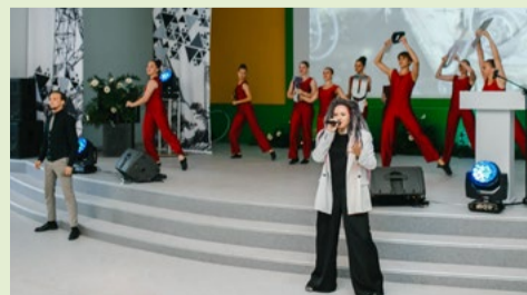
В этом году торжественное мероприятие ко Дню шахтёра проходило на новой сцене «Юбилейной»

Прославлять людей, которые «дают стране угля» и производят высококачественный угольный концентрат, – хорошая традиция. В течение года коллективы предприятий «ТопПром» устанавливают трудовые рекорды, участвуют в спортивных состязаниях, благоустраивают города, воспитывают молодёжь и за это получают