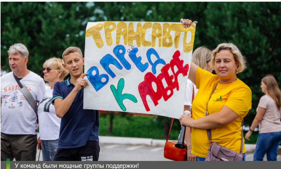
У команд были мощные группы поддержки!