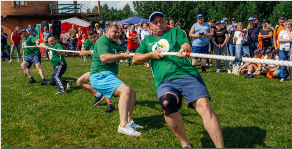
Самая зрелищная часть соревнований – перетягивание каната. Лучший результат показала ОФ «Коксовая»

24 июля сотрудники предприятий холдинга собрались на большой зелёной территории стрелкового клуба «Кузнецкий». Праздник для топпромовцев получился по-настоящему семейным, но присутствовал и спортивный азарт. Ведь командам предстояло выяснить, кто в этом году получит кубок победителя ежегодной корпоративной спартакиады. Было жарко!