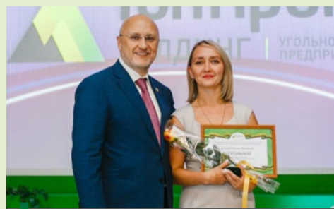
188 сотрудников предприятий холдинга «ТопПром» получили награды ко Дню шахтёра

«ТопПром» – от судьбы мы подарков не ждём. «ТопПром» – всегда лучшее в деле своём...» Этими строками из гимна холдинга открылось праздничное собрание на шахте «Юбилейная». Она встретила