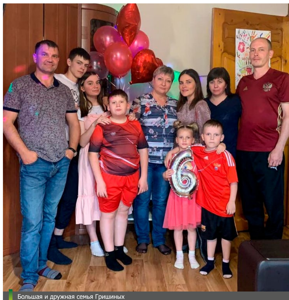
Большая и дружная семья Гришиных