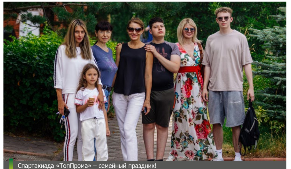
Спартакиада «ТопПром» – семейный праздник!