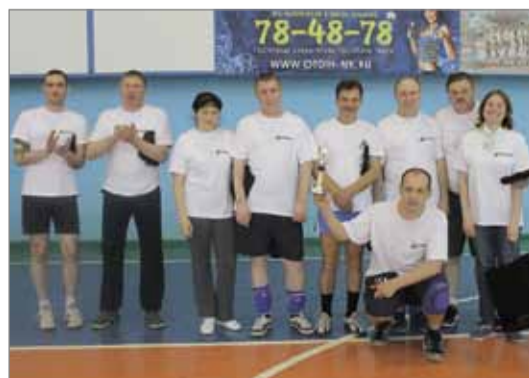
III место – АО «ТопПром»