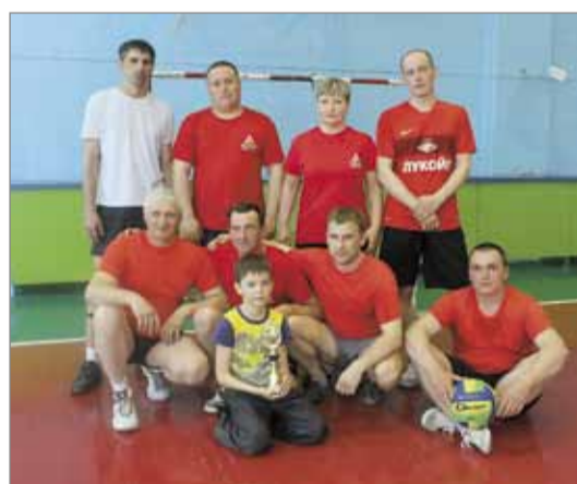
II место – ЦОФ «Щедрухинская»