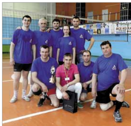
I место – шахта «Юбилейная»

В середине мая в СК «Родник» прошли соревнования по волейболу среди команд предприятий Холдинга «ТопПром».